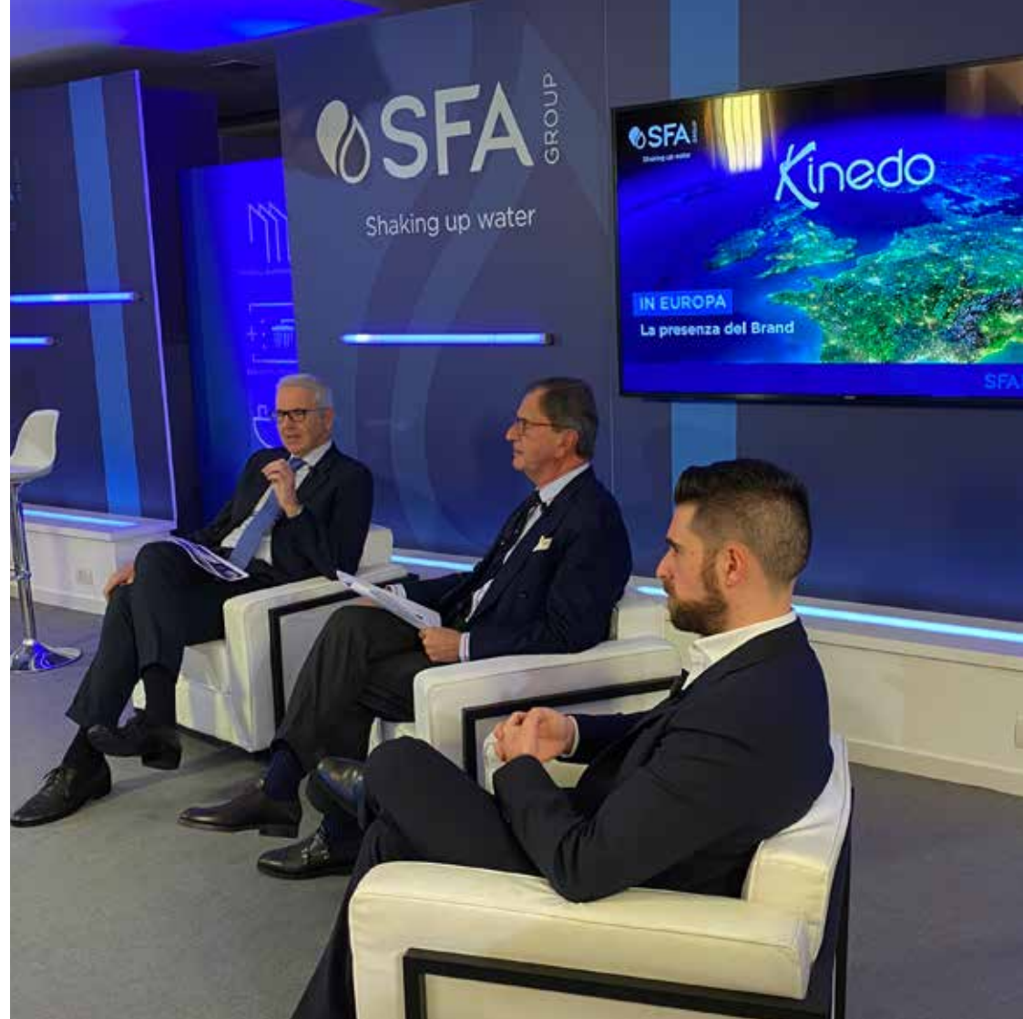
RELATORI E OSPITI