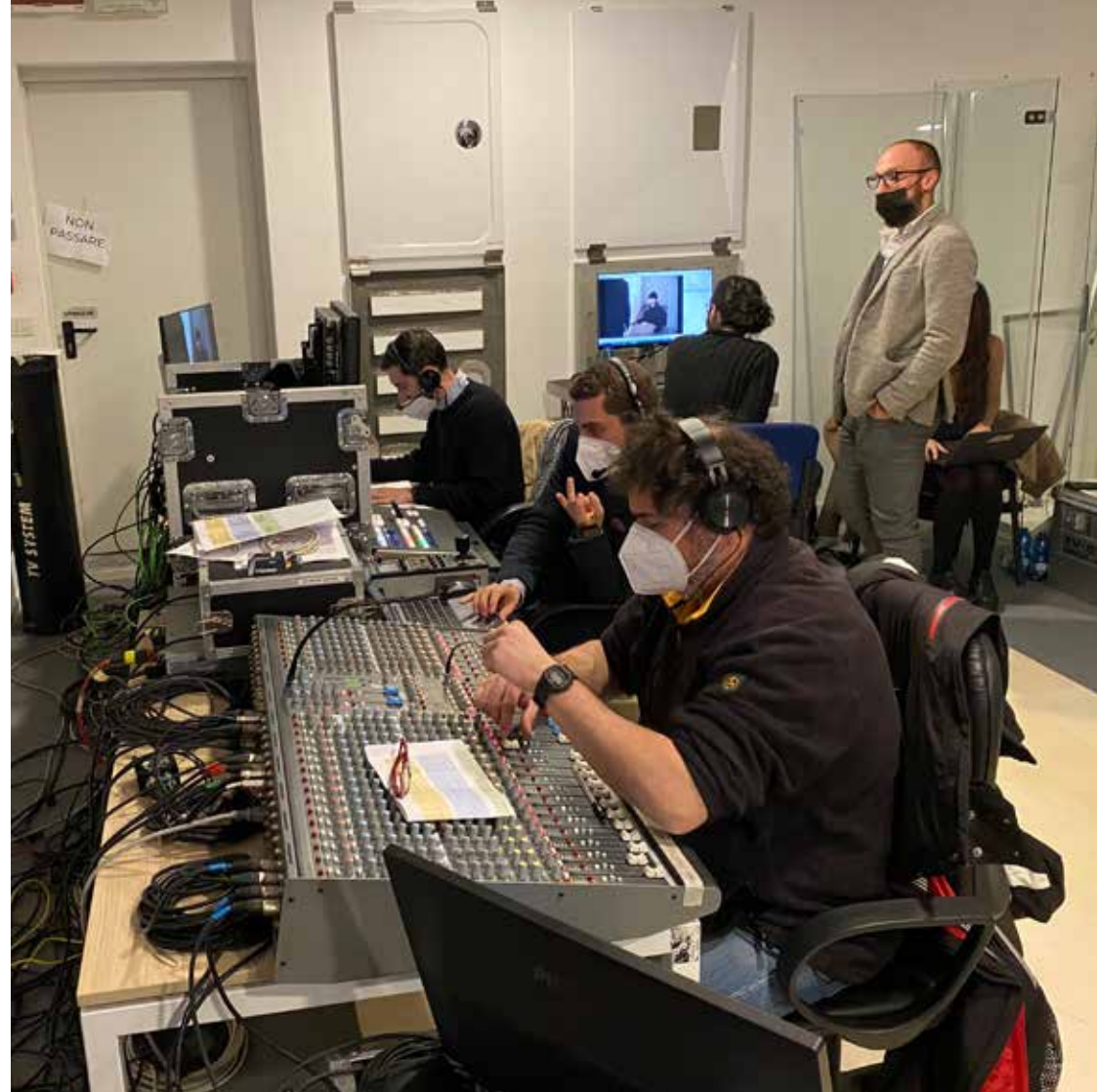
REGIA AUDIO VIDEO