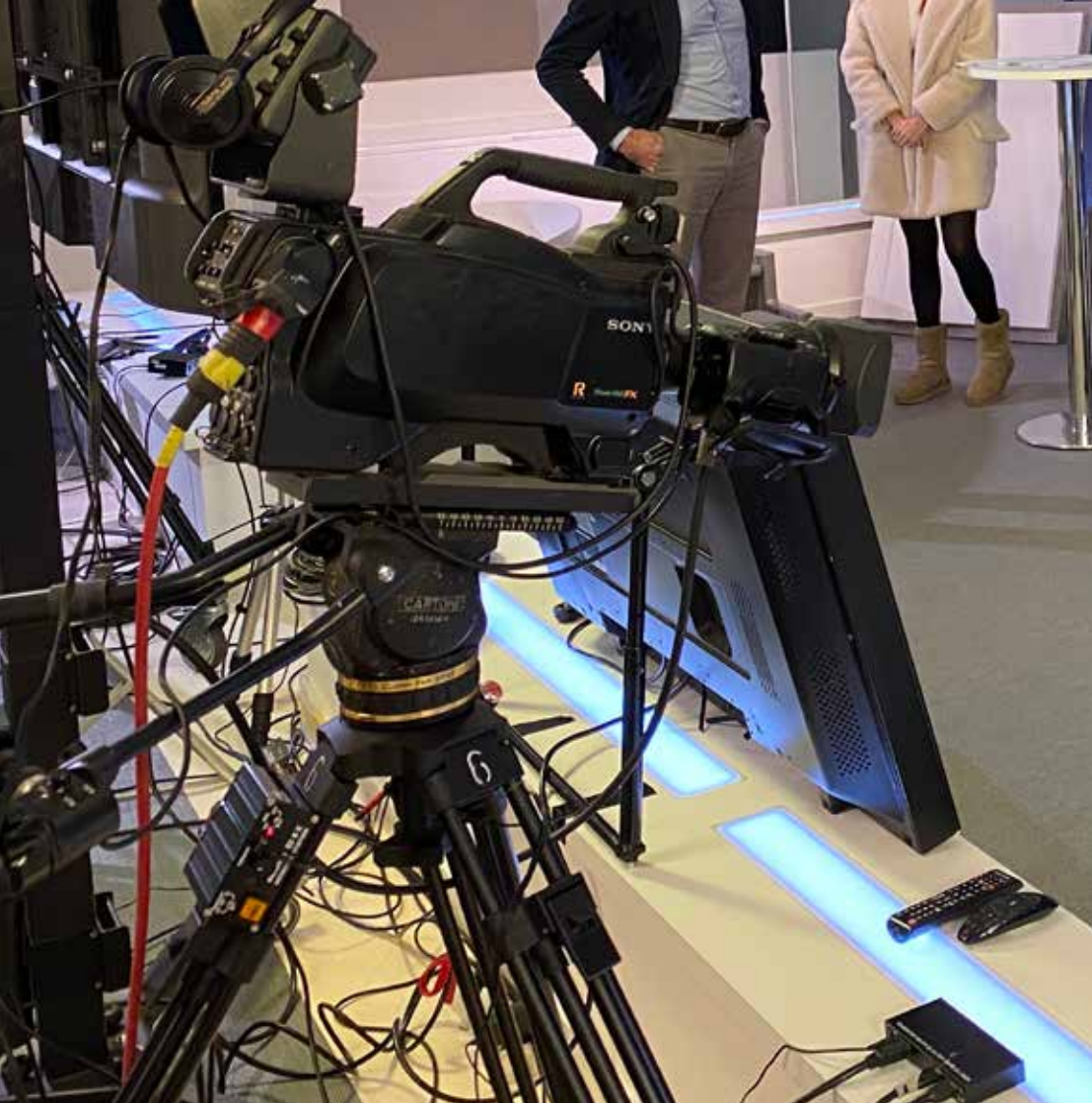
TECNICHE E CAMERE